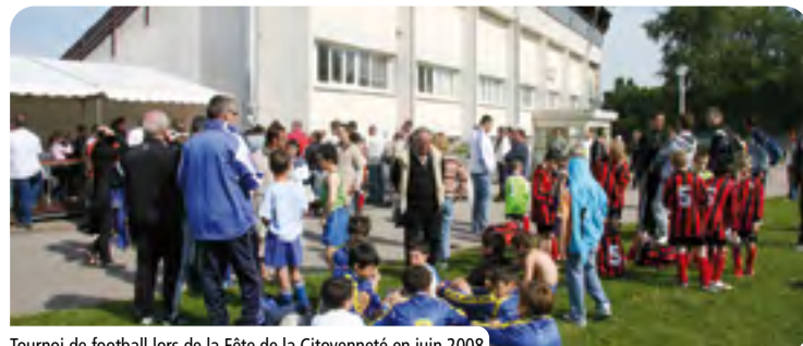
Tournoi de football lors de la Fête de la Citoyenneté en juin 2008