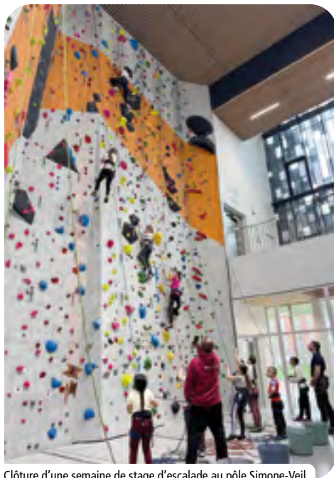
Clôture d'une semaine de stage d'escalade au pôle Simone-Veil.