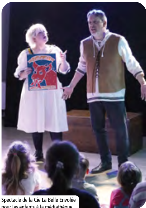
Spectacle de la Cie La Belle Envolee pour les enfants à la médiathèque.

+ D'IMAGES SUR LA PAGE FACEBOOK @VILLE.GONFREVILLELORCHER