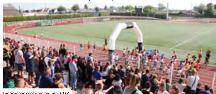
Les Foulées scolaires en juin 2023