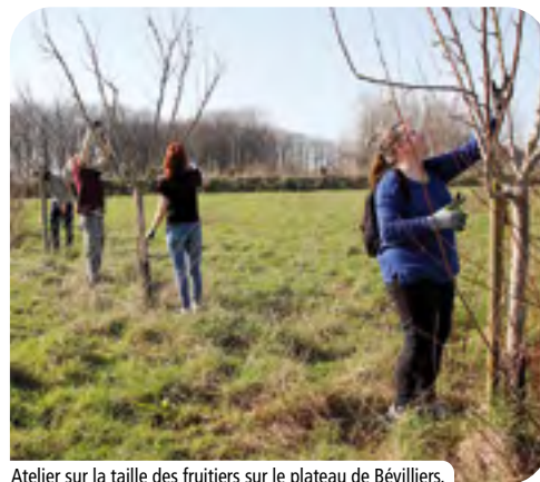
Atelier sur la taille des fruitiers sur le plateau de Bévilliers.