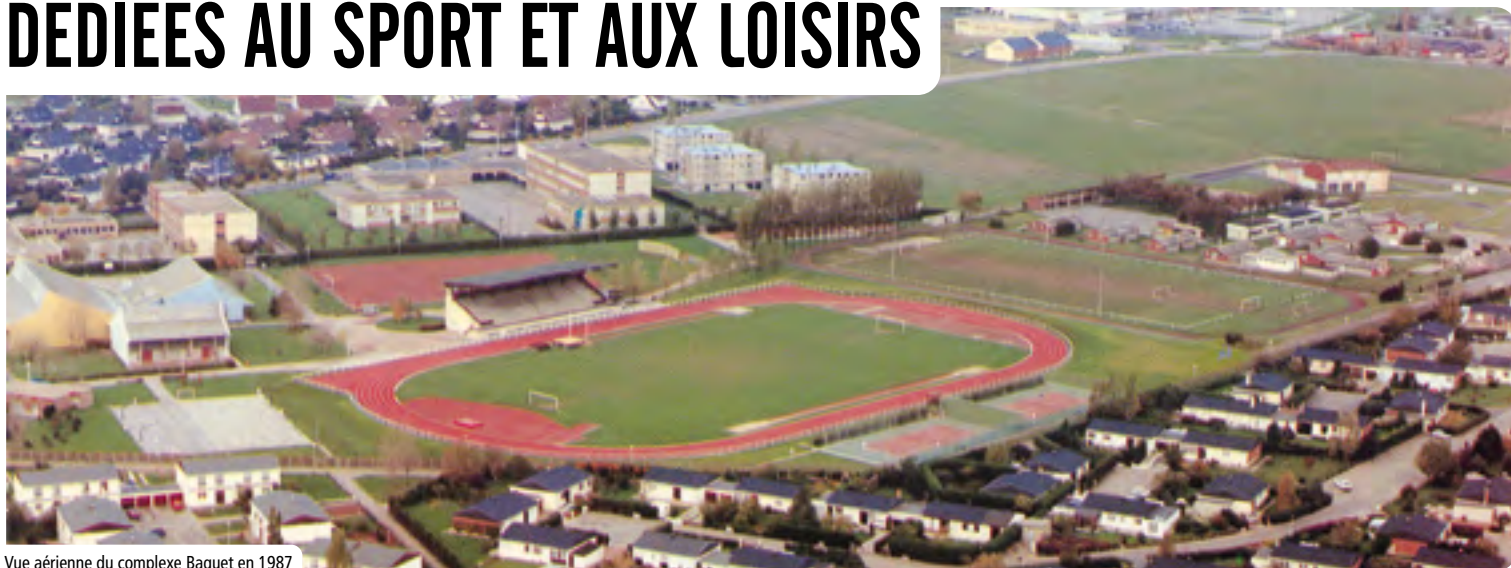
Vue aérienne du complexe Baquet en 1987

A près cinquante ans de bons et loyaux services, la tribune du complexe sportif Maurice-Baquet avait vieilli. Une nouvelle s'apprête à lui succéder, moderne, sécurisée et plus accessible.