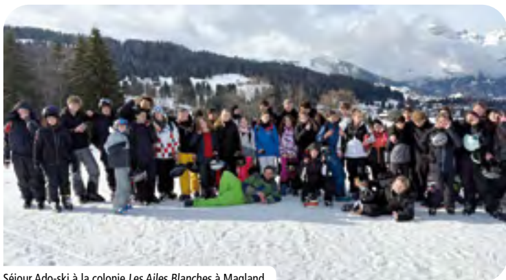
Séjour Ado-ski à la colonie Les Ailes Blanches à Magland.