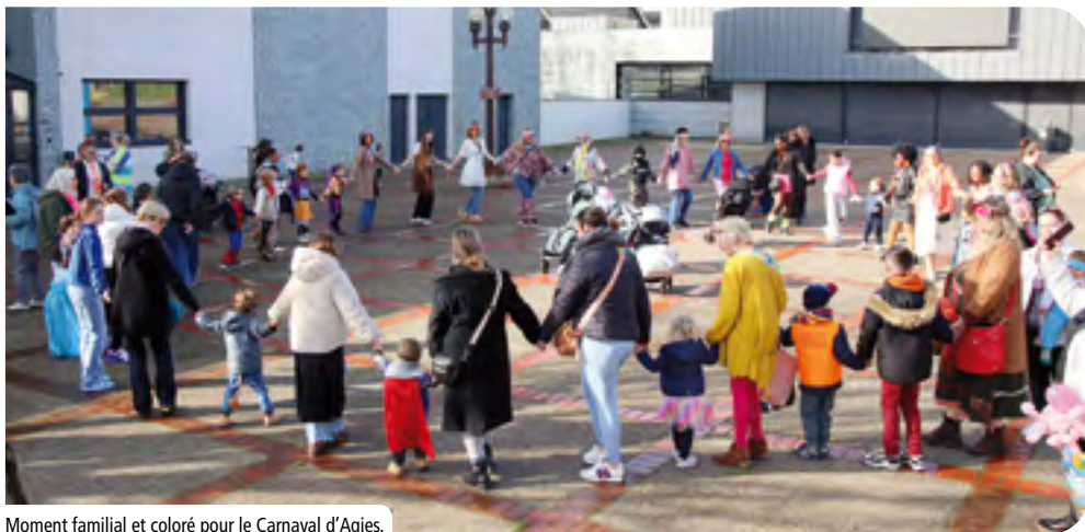
Moment familial et coloré pour le Carnaval d'Agies.