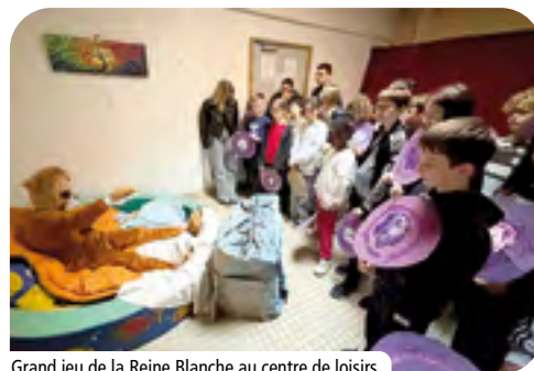
Grand jeu de la Reine Blanche au centre de loisirs.