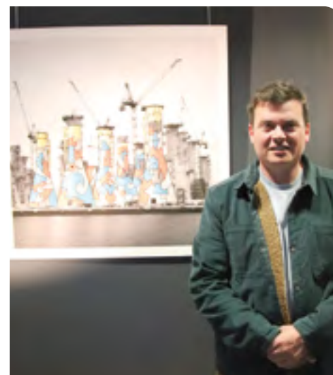
L'artiste BD.Art lors du vernissage de l'exposition (galerie de l'ECPC)

GALERIE DE L'ECPC • ENTRÉE LIBRE LES MERCREDIS, VENDREDIS ET SAMEDIS (14H-18H), LES SOIRS DE SPECTACLE ET PENDANT LES VACANCES SCOLAIRES