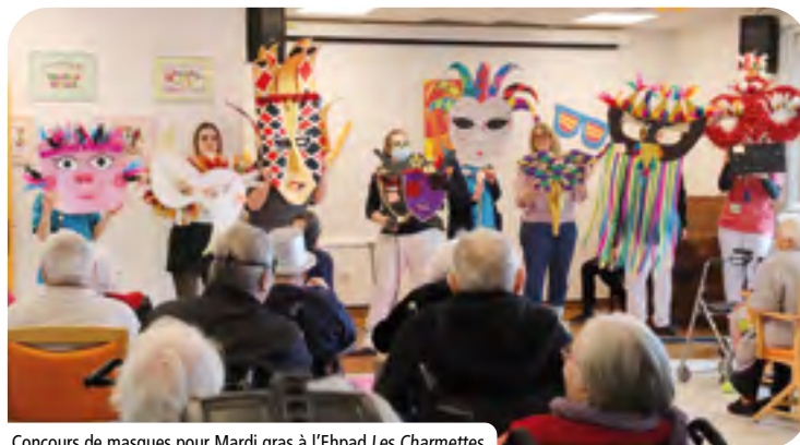
Concours de masques pour Mardi gras à l'Ehpad Les Charmettes.