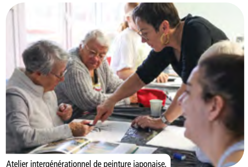
Atelier intergénérationnel de peinture japonaise.