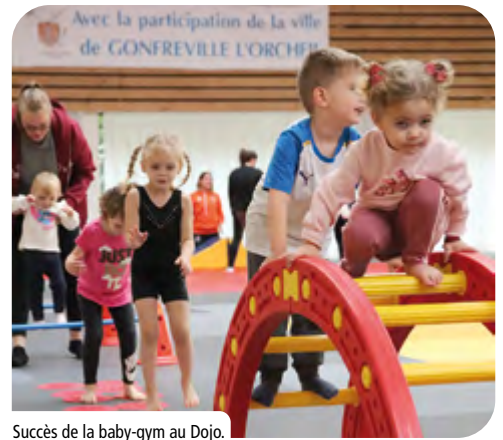
Succès de la baby-gym au Dojo.

+ D'IMAGES SUR LA PAGE FACEBOOK DE LA VILLE