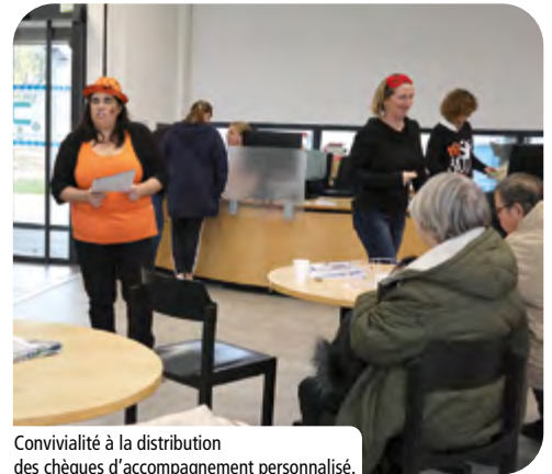
Convivialité à la distribution des chèques d'accompagnement personnalisé.