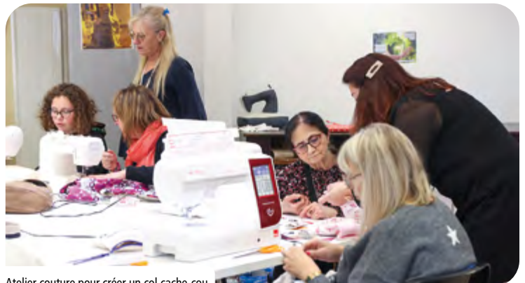
Atelier couture pour créer un col cache-cou.