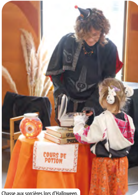
Chasse aux sorcières lors d'Halloween.

+ D'IMAGES SUR LA PAGE FACEBOOK DE LA VILLE