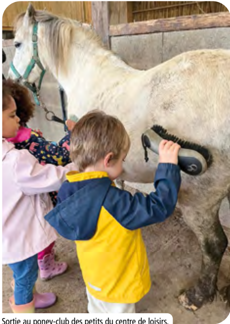
Sortie au poney-club des petits du centre de loisirs.