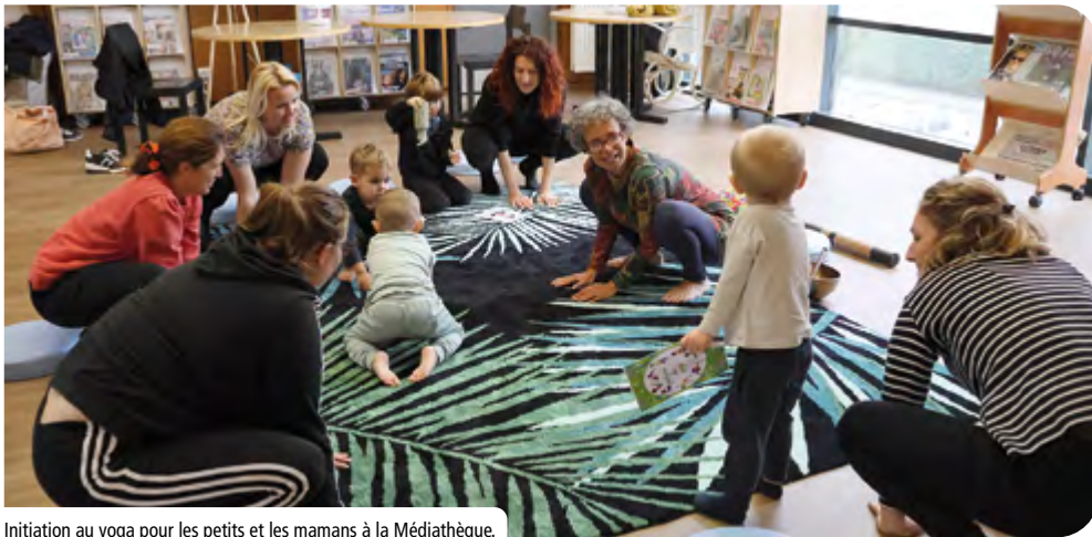
Initiation au yoga pour les petits et les mamans à la Médiathèque.