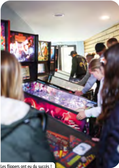
Les flippers ont eu du succès !