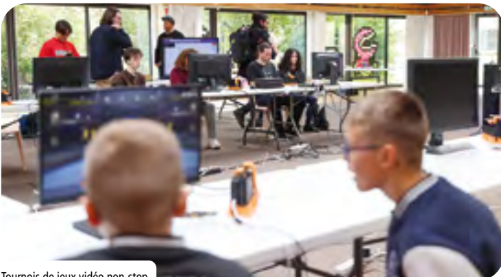
Tournois de jeux vidéo non-stop