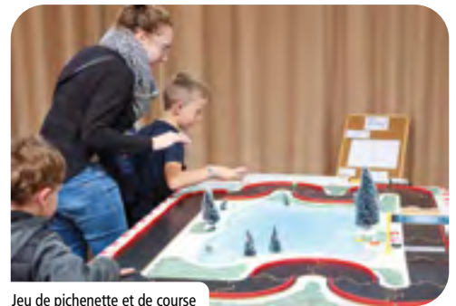
Jeu de pichenette et de course