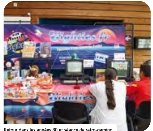
Retour dans les années 80 et séance de retro-gaming