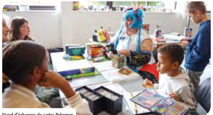
Stand d'échanges de cartes Pokemon