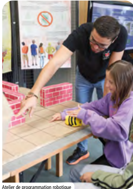
Atelier de programmation robotique