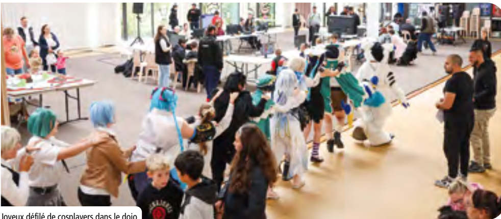
Joyeux défilé de cosplayers dans le dojo