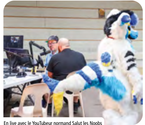
En live avec le YouTubeur normand Salut les Noobs