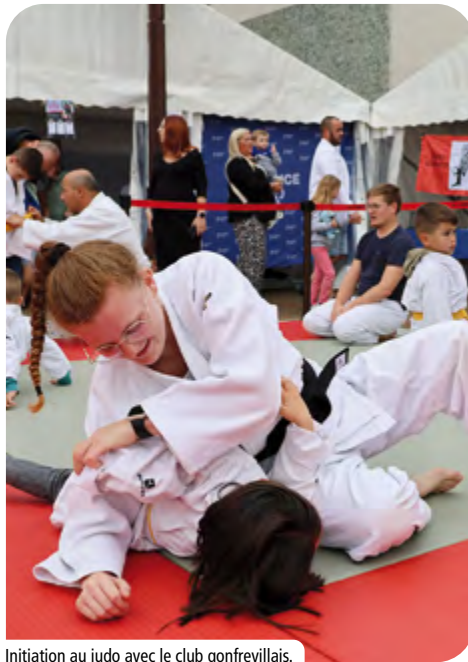
Initiation au judo avec le club gonfrevillais.

+ D'IMAGES SUR LA PAGE FACEBOOK DE LA VILLE