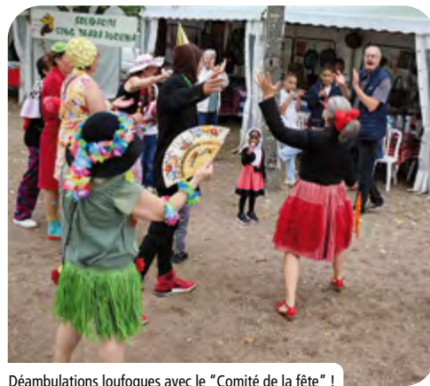
Déambulations loufoques avec le "Comité de la fête" !