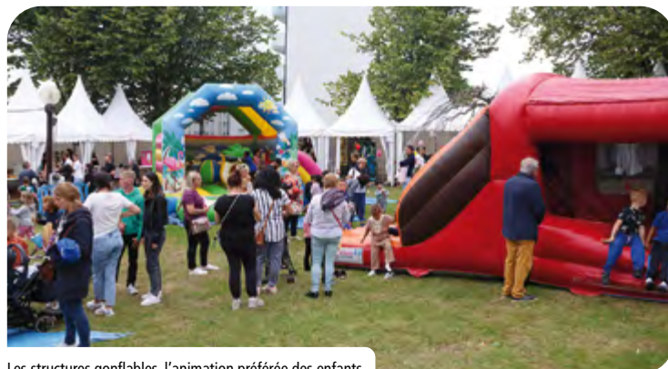
Les structures gonflables, l'animation préférée des enfants.