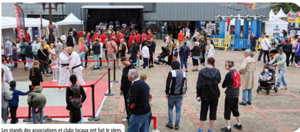
Les stands des associations et clubs locaux ont fait le plein.