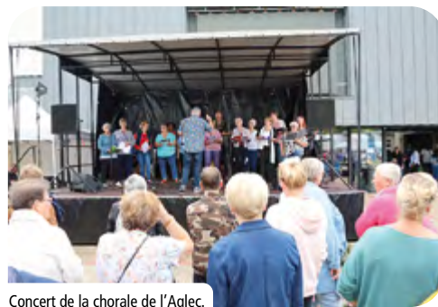
Concert de la chorale de l'Aglec.