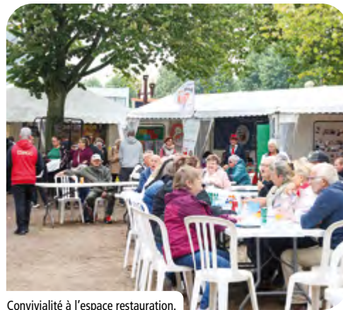
Convivialité à l'espace restauration.

+ D'IMAGES SUR LA PAGE FACEBOOK DE LA VILLE