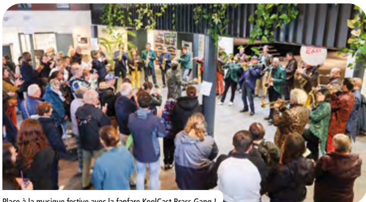
Place à la musique festive avec la fanfare KoolCast Brass Gang !