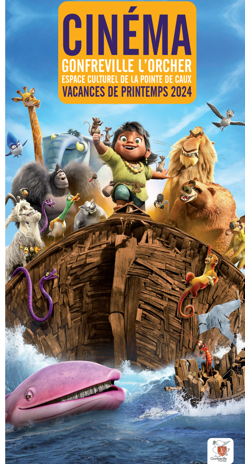
image de une extraite de Les aventuriers de l'Arche de Noé de Sergio Machado et Alois Di Léo - graphisme Sabine Turpin - Atelier municipal d'impression

14h30 Les aventuriers de l'Arche... de S. Machado & A. Di Léo • dès 6 ans 17h30 SOS Fantômes : la menace de glace de Gil Kenan • dès 10 ans 20h30 Godzilla X Kong : le nouvel empire de Adam Windgard • dès 10 ans