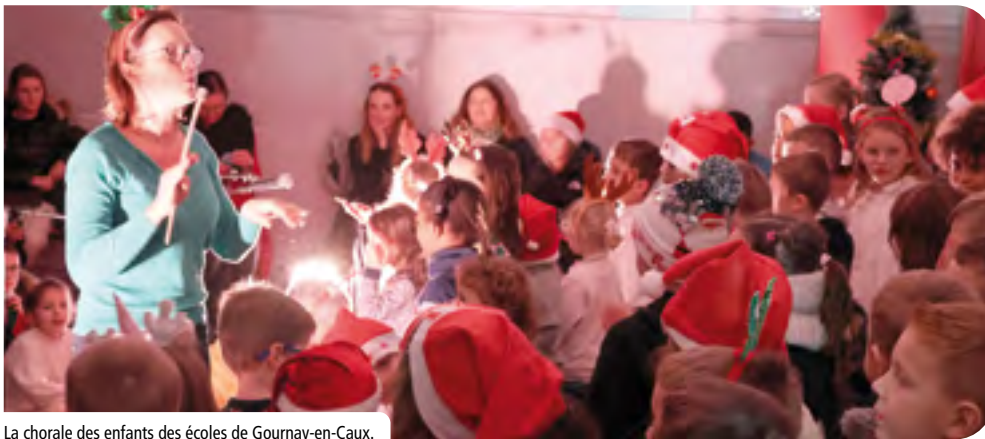
La chorale des enfants des écoles de Gournay-en-Caux.