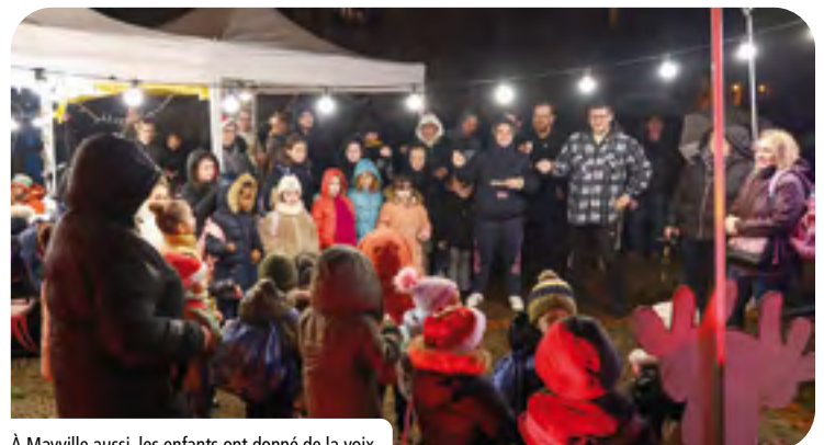
À Mayville aussi, les enfants ont donné de la voix.