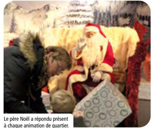
Le père Noël a répondu présent à chaque animation de quartier.

+ D'IMAGES SUR LA PAGE FACEBOOK DE LA VILLE