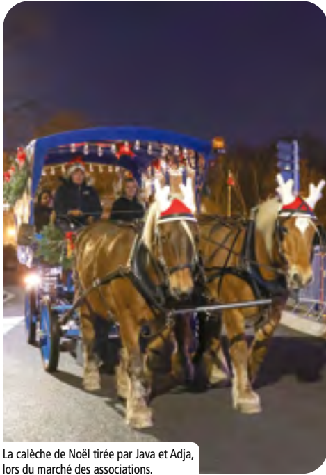
La calèche de Noël tirée par Java et Adja, lors du marché des associations.

Tout le mois de décembre, les animations festives se sont enchaînées. Les services municipaux et les associations locales se sont mobilisées pour créer une ambiance chaleureuse et rassembler les familles gonfrevillaises.