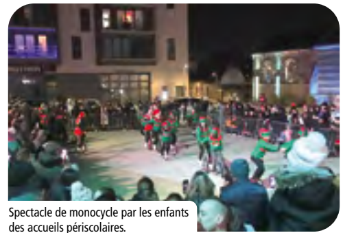
Spectacle de monocycle par les enfants des accueils périscolaires.