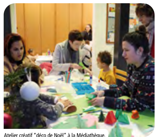
Atelier créatif "déco de Noël" à la Médiathèque.