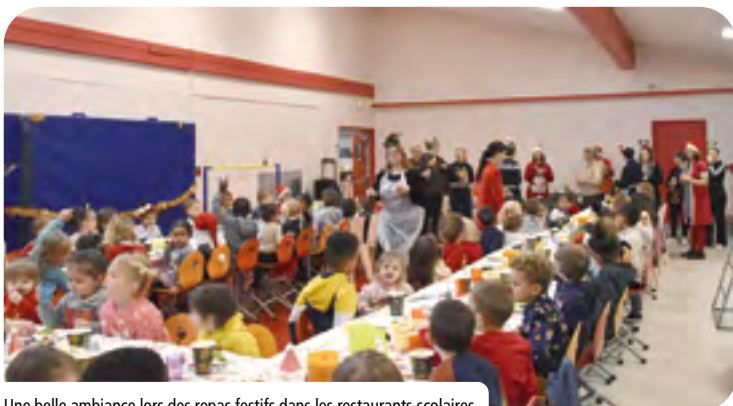
Une belle ambiance lors des repas festifs dans les restaurants scolaires.