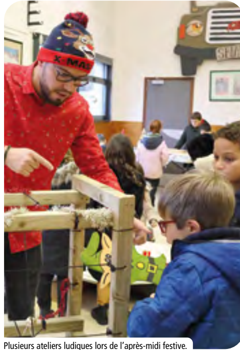
Plusieurs ateliers ludiques lors de l'après-midi festive.

+ D'IMAGES SUR LA PAGE FACEBOOK DE LA VILLE