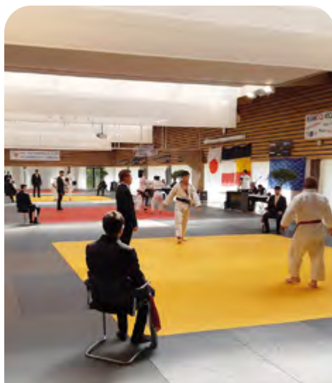
189 judokas et judokates ont participé à la 7 ème édition du Tournoi vétéran Viking Master de l'ESMGO Judo.

Vingt ans après avoir décroché le titre de la Ville la plus sportive de France du Challenge L'Equipe, Gonfreville l'Orcher continue de vivre aux rythmes des événements sportifs. La Municipalité soutient les associations et clubs, entre mise à disposition des équipements, soutien logistique lors des manifestations, aide à leur communication et attribution de subventions. Petit retour en images de quelques événements sportifs qui se sont tenus sur le territoire en mai et juin.