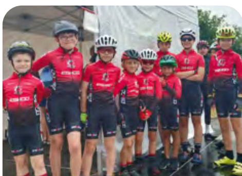
Organisé par l'ESMGO cyclisme, le challenge départemental des écoles de cyclisme a réuni 71 jeunes coureurs au Camp-Dolent le 18 juin.