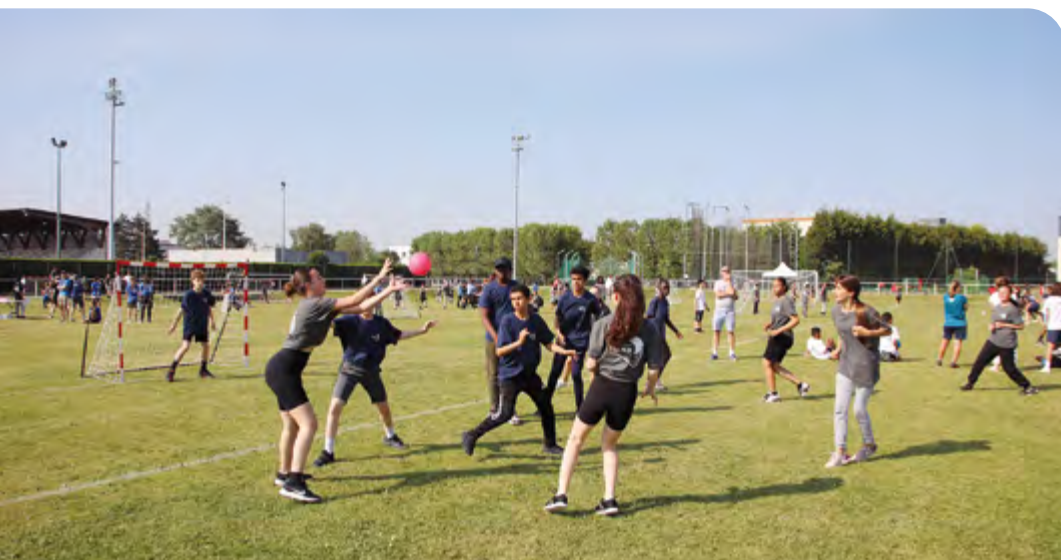
Les 14 et 15 juin, Gonfreville Handball a organisé l'opération Totalement Hand réunissant plus de 500 enfants et collégiens de l'agglomération au complexe Baquet.