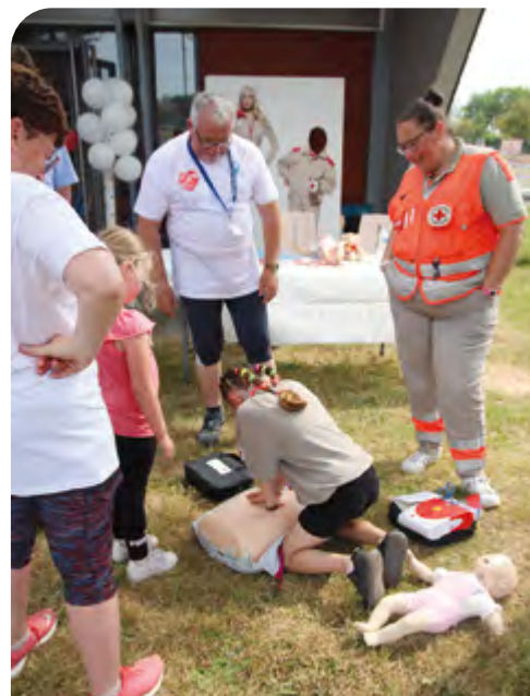
Opération prévention avec le Parcours du cœur organisé par l'OMS avec la Croix Rouge, l'ESMGO et la Ville.