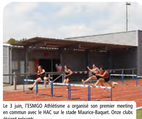
Le 3 juin, l'ESMGO Athlétisme a organisé son premier meeting en commun avec le HAC sur le stade Maurice-Baquet. Onze clubs étaient présents.

Vingt ans après avoir décroché le titre de la Ville la plus sportive de France du Challenge L'Equipe, Gonfreville l'Orcher continue de vivre aux rythmes des événements sportifs. La Municipalité soutient les associations et clubs, entre mise à disposition des équipements, soutien logistique lors des manifestations, aide à leur communication et attribution de subventions. Petit retour en images de quelques événements sportifs qui se sont tenus sur le territoire en mai et juin.