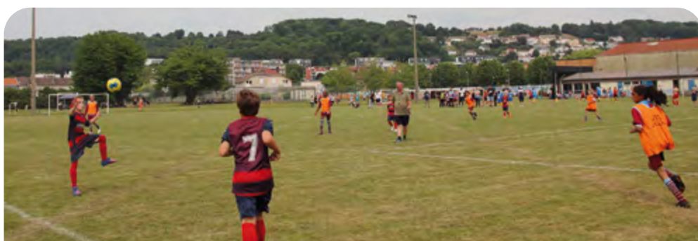
Pour son 30 ème anniversaire, le comité de jumelage a organisé un tournoi de football amical pour les jeunes. Une équipe de Teltow était présente.