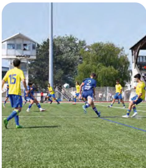
Le 31 e Tournoi International U17 de l'ESMGO Football a réuni 8 équipes dont 3 originaires d'Irlande, d'Ecosse et d'Espagne.