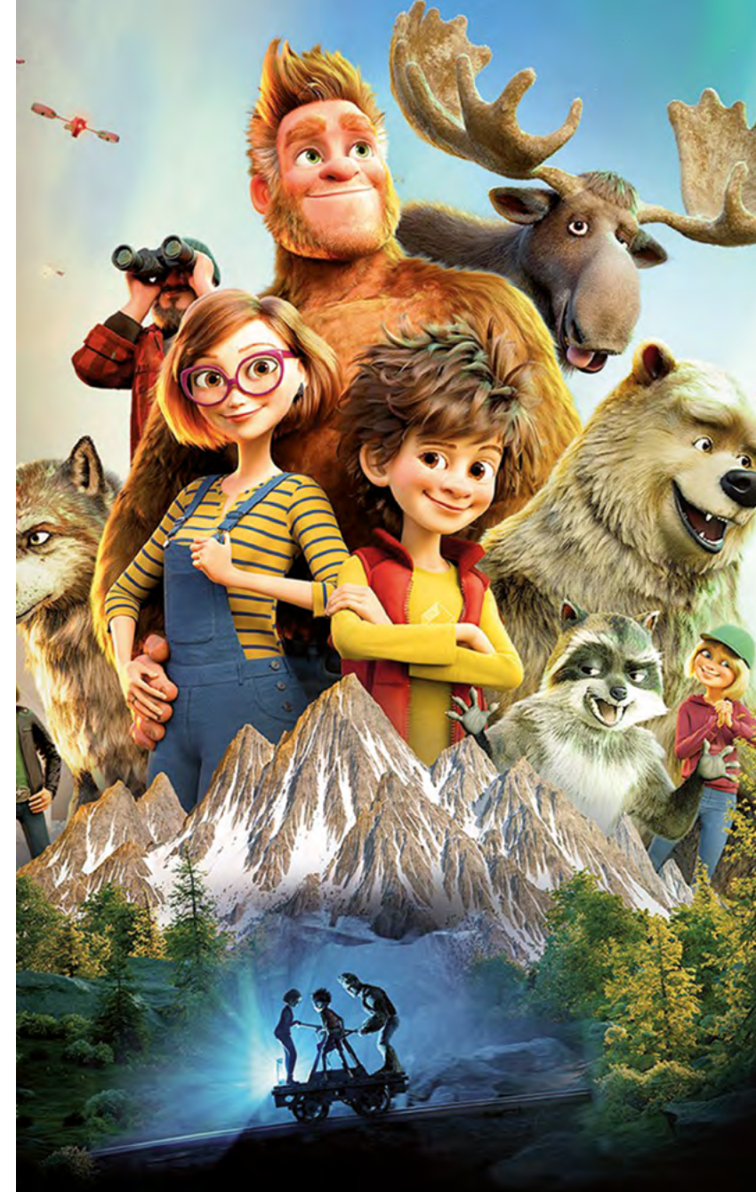
image de une extrait de Bigfoot family - graphisme Sabine Turpin - Atelier municipal d'impression

14h30 Les blagues de Toto de Pascal Bourdiaux • dès 6 ans 17h30 Le bonheur des uns de Daniel Cohen 20h30 L'aventure des Marguerite de Pierre Coré • dès 8 ans