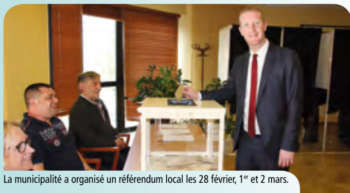
La municipalité a organisé un référendum local les 28 février, 1 er et 2 mars.

Le 11 mars, une dizaine de Gonfrevillais a suivi une formation de secourisme au sein de l'espace prévention Ambroise-Croizat au pôle Santé. Organisée et prise en charge par l'atelier Santé ville de la communauté urbaine, la formation était dispensée par l'unité locale de la Croix Rouge Le Havre. Pendant huit heures, les stagiaires volontaires ont suivi plusieurs modules : initiation à la réduction des risques, les urgences vitales, les malaises, les étapes des premiers secours... L'objectif est de reconnaître les situations d'urgence pour savoir réagir avec efficacité. A la fois théorique et pratique, la formation a permis aux stagiaires d'obtenir leur attestation Prévention et Secours Civiques de niveau 1 (PSC1). Une autre session est organisée le 8 avril. Plus de photos sur la page Facebook de la Ville .